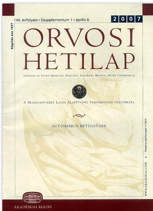
4. ábra. Az Akadémiai Kiadó gondozásában megjelenő Orvosi Hetilap címlapja 2007-ben

mindig szabadságában áll szellemi termékeivel valamely idegen nemzet irodalmában fellépni, mi reá nézve talán előnyös, mert nagyobb számú közönséghez szól, ámde ilyenkor ezen irodalom munkásává válik, s bár nevezetes szerepkört vívhat ki magának, de hazája művelődésére befolyás nélkül marad.”