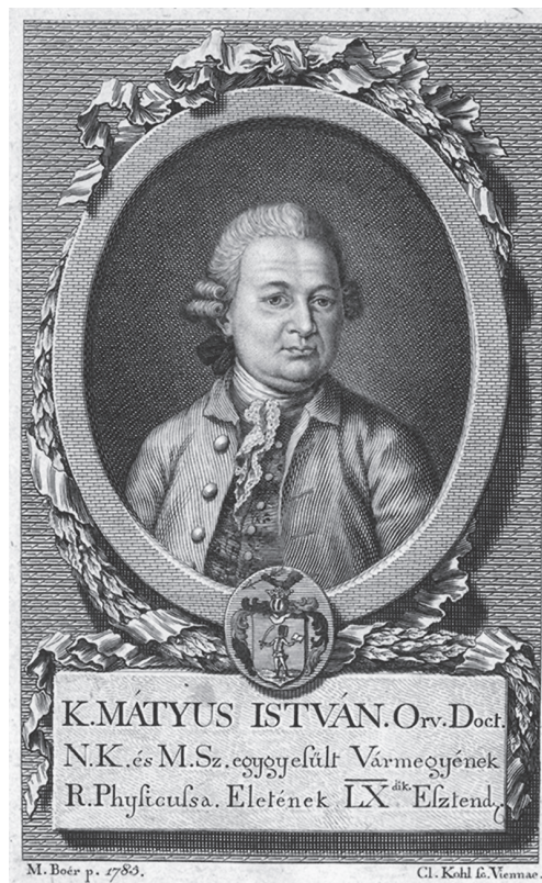
Máttyus István portréja az Ó és Új Diaetetica első kötetében

A Diaeticáról valamennyi kortárs és későbbi elemző úgy szól, hogy kiemeli a szép, „ízes erdélyi” nyelvezetet, előadásmódot. A mai olvasó számára néha kissé nehézkesnek tűnhet, de ez valamennyi korabeli magyar nyelvű írást jellemzi, a még nem egységesített helyesírás és a mondatszerkesztés egyenlenségei miatt.