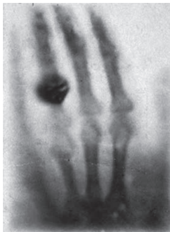
Röntgen feleségének keze 1895. november 22.