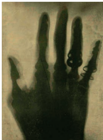
Báró Eötvös Loránd keze 1896. január 19.