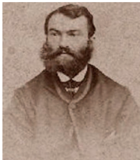
James Parkinson (1755–1824) angol születésű és gyökerű orvos, tudós, akít elfelejtettek az angolok és az egész világ (Rowntree, 1912)

Még egy példát említnék, főleg magyar vonatkozása miatt. James Parkinson 1817-ben írta le a későbbiekben róla elnevezett kór tüneteit. Pontosan, szépen, mind a négyet. Szinte nyom nélkül elfelejtették. 1912-ben, közel 100 évvel később Rowntree ásta elő Parkinson közleményét, ismertette, és attól kezdve a betegség neve Parkinson-kór. (Olyannyira elfeledett volt, hogy először Rowntree maga is tévesen „Patterson”-nak nevezte.)