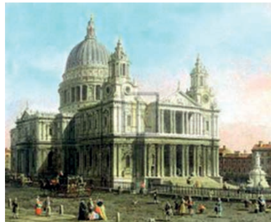
A Szent Pál-székesegyház. Tervezte Sir Christopher Wren; itt található végső nyughelye

Ez nyavalya à Főnek nyavalyái közzé számlálatik, mivelgyakrabban à Főből le-űivárkozó nedvelségektől vélsen eredetet, mellyek az agyvelőből alá származó apró inakat vagy nervusokat el-árfáztyaks' erőlenitik.